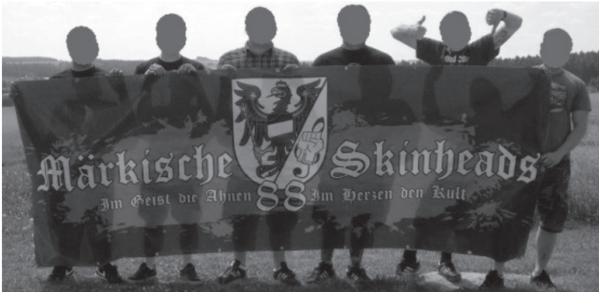
Märkische Skinheads 88.

löst. Außerdem besitzt Wolinski wie auch die MS88 Kontakte zu den „Hammerskins“, einem Neonazinetzwerk, welchem auch DST angehören. Die Hammerskins ist ein internationales Neonazinetzwerk, welches Rechtsrock-Konzerte organisiert und rechtes Liedgut vermarktet. Die Organisation ist in „Chaptern“, ähnlich wie Rocker, organisiert – ihre Mitglieder tragen Kutten. Das Erkennungsmerkmal der Hammerskins ist ein Logo bestehend aus zwei gekreuzten Hämmern auf einem Zahnrad. Viele Hammerskin-Mitglieder haben sich das Logo auf den Körper tätowiert. 2012 veranstalteten die MS88 zusammen mit dem Kameradschaftsbund Bargischow ein „RAC-Nacht“ (Rock against Communism) in einem ehemaligen Schweinestall in Viereck.