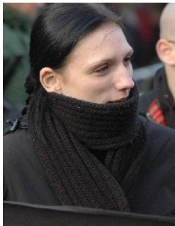
Naziaufmarsch Celle Dez. 2006